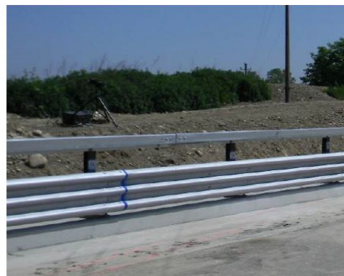
BPL58a H2 W3 VI2 ASI B